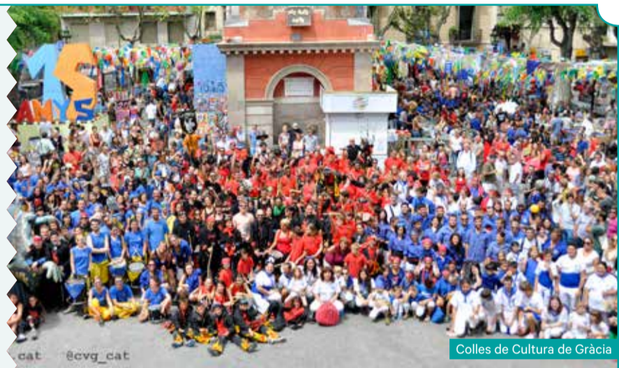
Colles de Cultura de Gràcia

Com cada any, per tancar el Festival Tradicionari comptem amb la participació de les Colles de Cultura de Gràcia en cercavila de la Plaça de la Vila al C.A.T. Bastoners de Barcelona, Colla Vella de Diables de Gràcia, Associació Cultural Colla del Drac de Gràcia, Colla de Bastoners de Gràcia, La Diabòlica de Gràcia, Geganters de Gràcia, La Malèfica del Coll, Gaudiamus, Castellers de la Vila de Gràcia i Trabucaires de Gràcia.