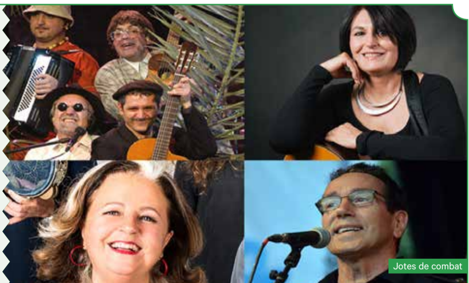
Jotes de combat