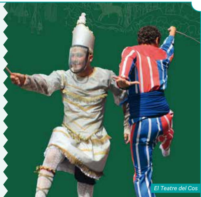
El Teatre del Cos

Les tradicions líriques trobadoresques i joglaresques occitanocatalanes, franceses, andalusines i castellanes, la influència dels mestratges de dansa italiana, així com les coreografies representatives dels gremis urbans, les pràctiques rituals cristianes o les performances rurals constitueixen algunes de les contribucions que se situen a l'origen de la coreùtica d'aquests territoris.