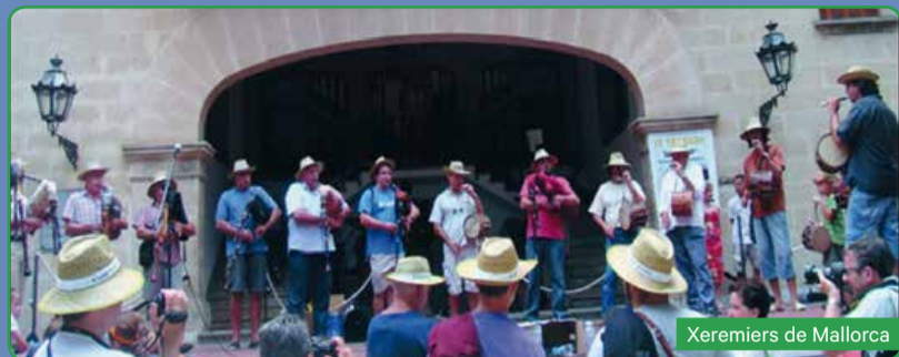
Xeremiers de Mallorca