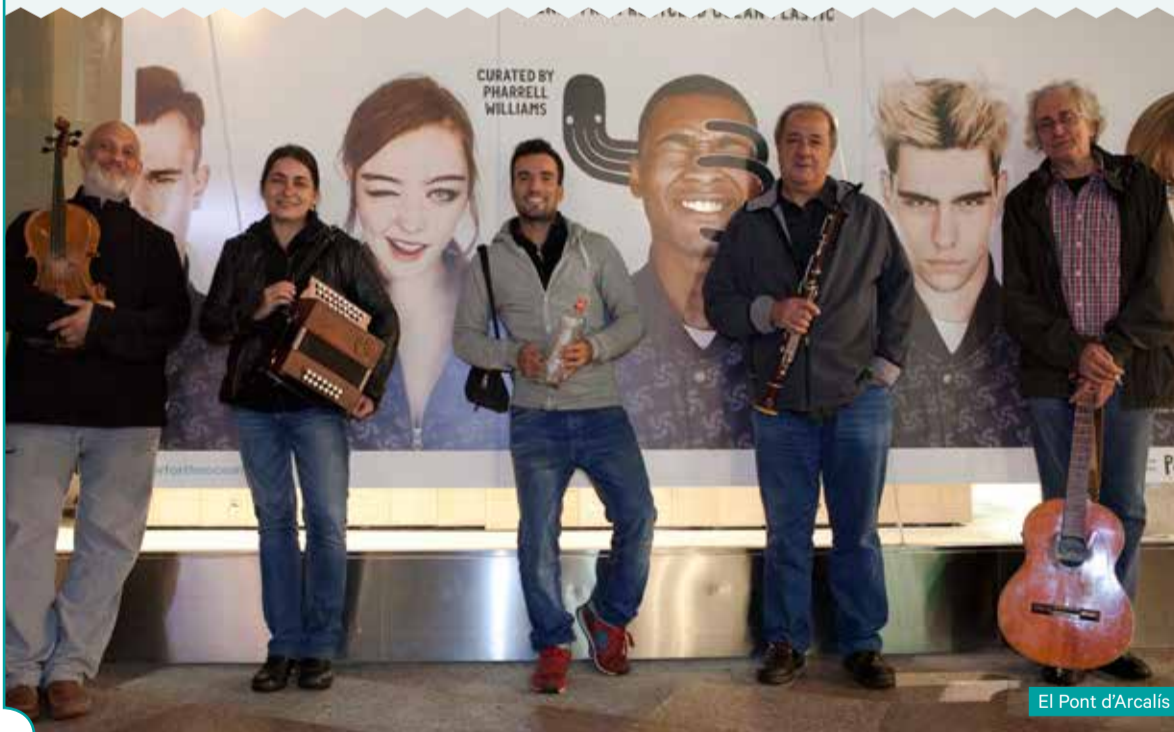
El Pont d'Arcalís

Serà una gran festa - Festa handi bat izango da!