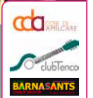
Il nuovo che avanza