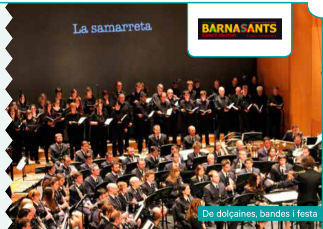
De dolçaines, bandes i festa

En aquesta segona edició de la trobada internacional dedicada a Bianca d'Aponte es presentaran cançons traduïdes a diferents idiomes de la jove cantautora, desapareguda el 2003 amb només 23 anys. Hi haurà una trobada entre la cançó i la literatura femenina, cançons sobre versos de dones poetes o dedicats a elles. Aquest concert al Tradicionàrius serà el primer d'una gira que continuarà a Itàlia, a Anversa i Sanremo.