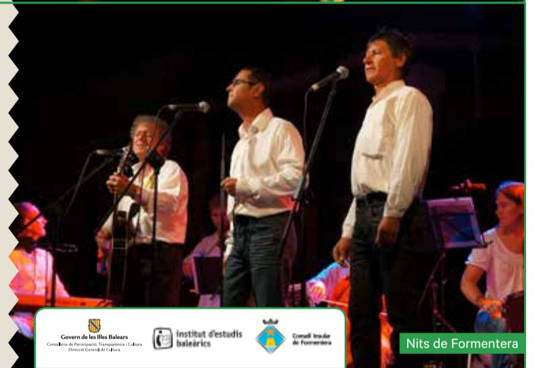
Nits de Formentera

Tramudança és un grup de música folk que des de fa mes de trenta anys anima ballades i treballa per mantenir viva la nostra tradició i cultura. Disposa d'un repertori de jotes, boleros, fandangos, mateixes (típiques del Llevant mallorquí), tonades i cançons populars. Algunes són de creació pròpia, altres, de recerca, i la resta, populars. En trenta anys, han actuat per la majoria d'indrets de Mallorca, Menorca i Eivissa, així com en diferents indrets de Catalunya i la Catalunya del Nord. Tramudança està format per set músics, que interpreten peces vocals i instrumentals, amb instruments típics de la nostra música: violí, guitarra, guitarró, llaüt, mandola, baix, mandolina, flauta i percussió.