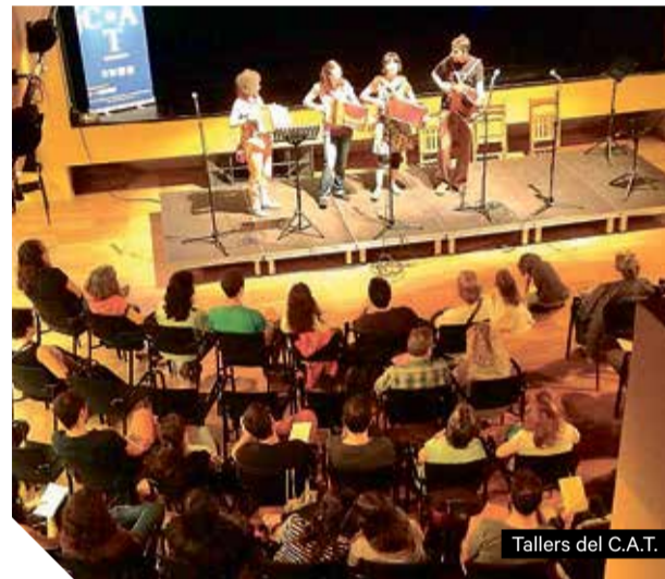
Tallers del C.A.T.