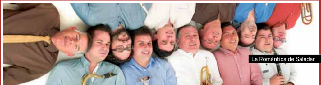
La Romàntica de Saladar