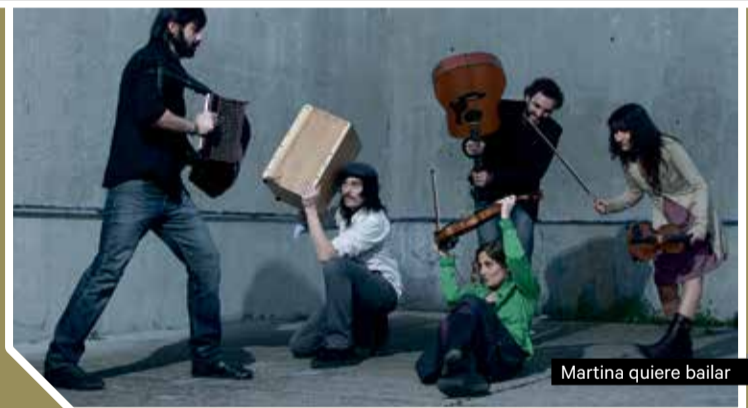
Martina quiere bailar

Ballaveu explora la pràctica de les cançons per fer ballar. Les seves veus juguen amb el repertori del cançoner tradicional i popular català, de nord a sud i d'est a oest: balls plans del Pallars, jotes de l'Ebre, havaneres de l'Empordà... que han omplert places i envelats arreu del país. Martina Quiere Bailar és un quintet acústic que neix l'any 2010: melodies de violins i acordions diatònics, acompanyades d'una guitarra acústica i percussions d'aires afrolatins. Influenciats per la música folk del centre d'Europa, impregnen el seu so de matisos de la música popular francesa i d'altres països de l'entorn.