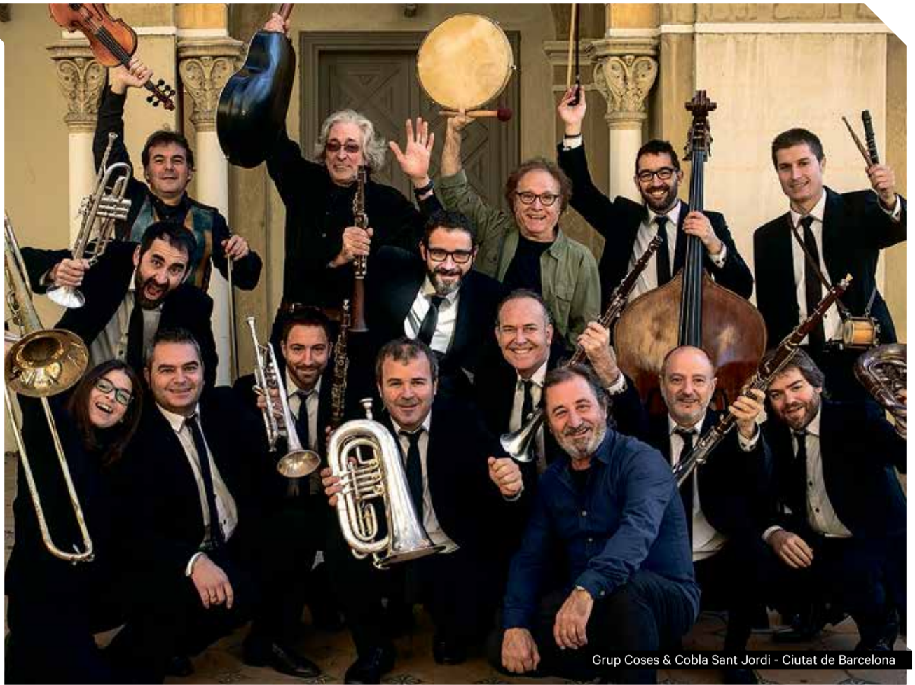
Grup Coses & Cobla Sant Jordi - Ciutat de Barcelona