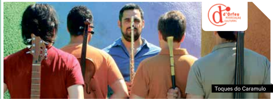
Toques do Caramulo