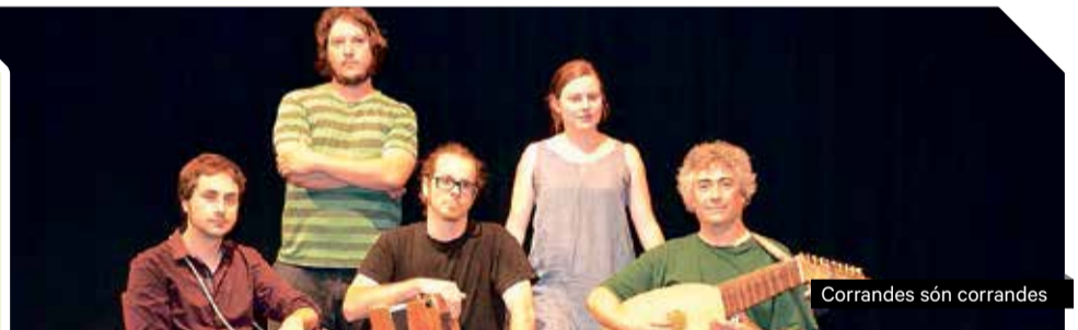
Corrandes són corrandes

Podreu conèixer de primera mà el Hardanger fiddle (violí folk noruec) en un taller amb una petita introducció sobre la història de l'instrument, una breu explicació de la seva utilització i la diferència entre el violí comú i el violí folk noruec. A més, experimentareu amb l'instrument de manera pràctica i aprendreu cançons tradicionals del seu repertori. El taller està dirigit a instrumentistes i cantants.