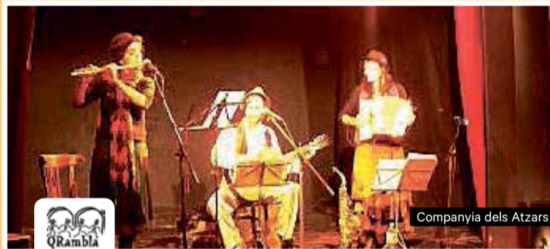
Companyia dels Atzars