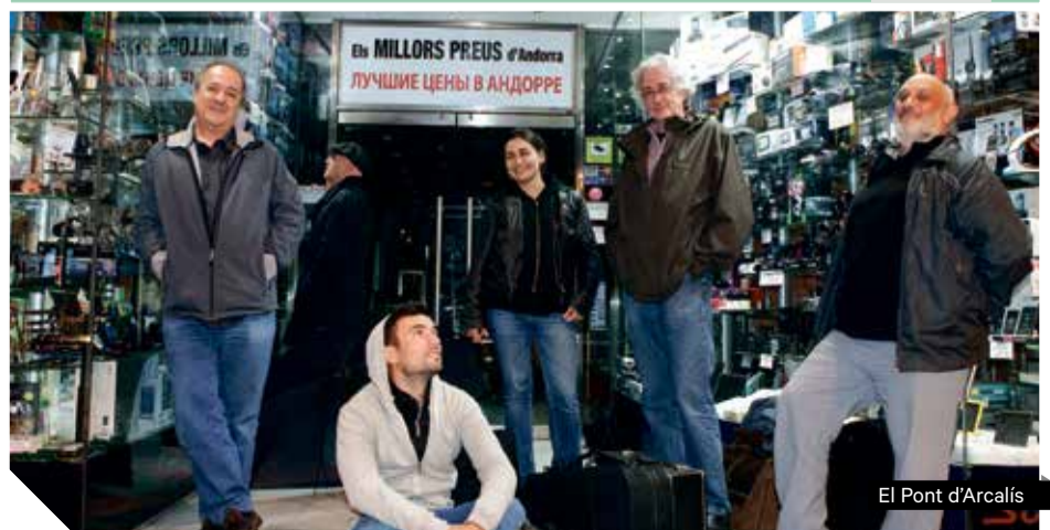
El Pont d'Arcalís