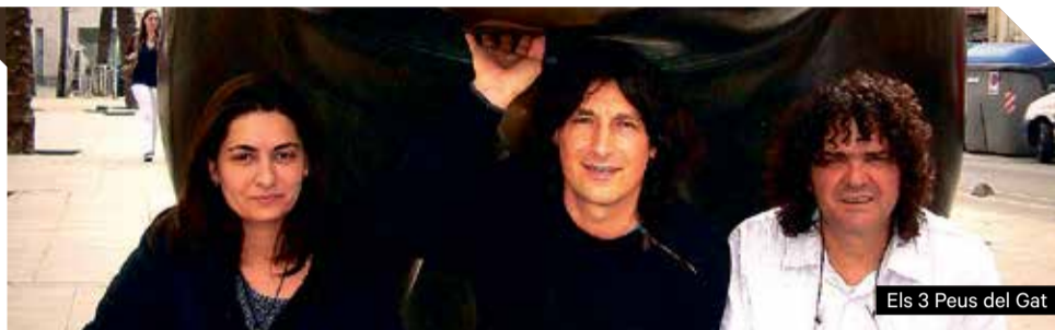
Els 3 Peus del Gat

Quan el pop rock estava en auge i les modes es decantaven per la música electrònica, un grup d'Alhama de Múrcia, que tocaven rondalles i feien cançons d'autor, decideixen ajuntar-se i construir els seus temes creant un so propi, influenciat per tot tipus de músiques i cultures. El folk, el rock i tot el que un es pugui imaginar es fonen en un lloc, Malvariche , que es convertirà finalment en un dels grups més divertits i amb més ritme del país. Després de vint-i-tants anys essent diferents han decidit crear un espectacle més tranquil i elaborat, i aparcar per un moment la música electrònica per recrear-se amb un so més tranquil i acústic que recorda als seus principis. Malvariche en acústic fa un recorregut pels temes més representatius de la seva història i més intimista. El repertori està compost de temes tradicionals i propis que repassen totes les èpoques del grup. Malvariche en acústic és diferent i també divertit, ja que els seus temes estan compostos per melodies alegres i rítmiques.