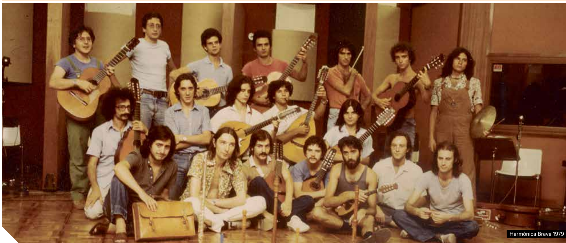
Harmònica Brava 1979