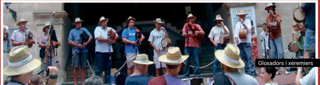
Glosadors i xeremiers