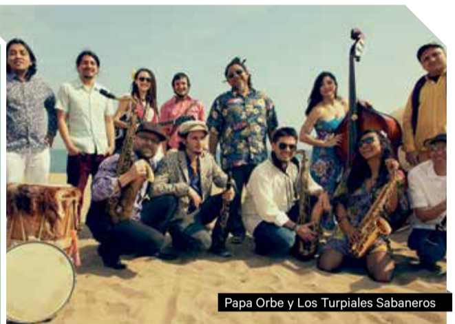
Papa Orbe y Los Turpiales Sabaneros