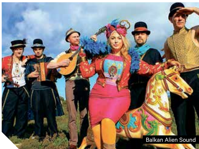
Balkan Alien Sound