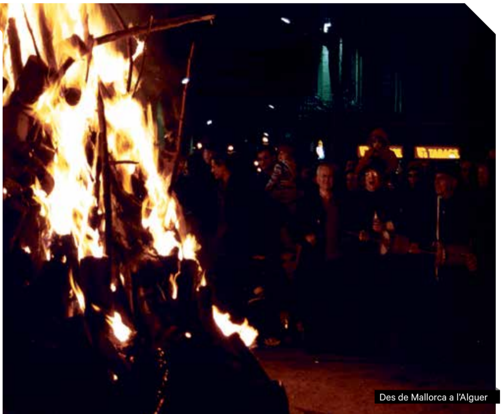
Des de Mallorca a l'Alguer

Ballugall es crea amb l'objectiu principal de reviuir el projecte Racó de Tramuntana (Associació Pollencina de Ball), que es presentarà poc temps després de l'estrena del grup. Componen els seus propis temes com Jota de tardor i amplien el repertori amb l'objectiu que totes les peces es puguin ballar i que els balladors en puguin gaudir. Ballugall no només fa temes de ball de pagès, la seva intenció és tenir un repertori de músiques tradicionals del món i de la nostra cultura popular i així contribuir a la seva difusió, perdurabilitat i innovació.