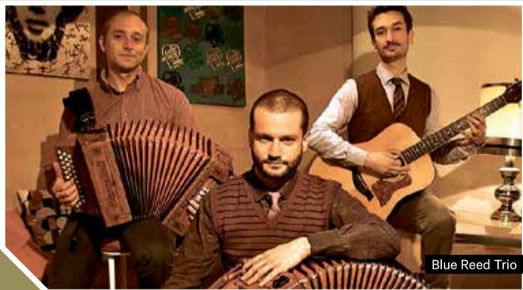
Blue Reed Trio

La Viu-viu , integrada per l'acordionista Cati Plana i el multiinstrumentista Eduard Casals , presenta nou disc, Amics , una aventura ballable assegurada. Completaran el cartell el duet BALLa2 (País Valencià), integrat per Amadeu Vidal i Eduard Navarro , i els italians Blue Reed Trio , una trobada musical de tres músics provinents de diferents estils que va donar lloc a l'aparició d'aquest emocionant conjunt de creadors d'una música refinada, sense deixar de ser compatible amb les normes de la dansa.