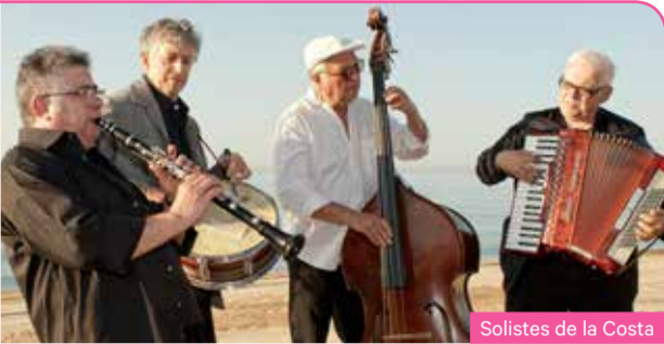
Solistes de la Costa

Els occitans Coriandre us proposen una nit de ball folk d'Occitània, amb la peculiar energia que els defineix.