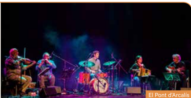
El Pont d'Arcalís

Vetllada pirinenca que unirà dues generacions. Els veterans El Pont d'Arcalís, amb més de vint-i-cinc anys de trajectòria, faran un recorregut pel seu extens repertori de divulgació del patrimoni cultural i musical pirinenc, i en especial pel darrer treball discogràfic, La Seca, la Meca i les valls d'Andorra . Tancarà la sessió el sextet Orquestrina Trama, format per joves de l'Alt Urgell i la Cerdanya, que faran una sessió de ball folk per "fer de la festa una festa de tots".