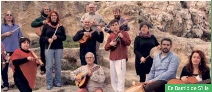
Es Bastió de S'Illa