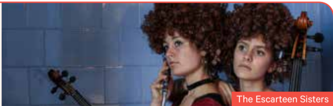
The Escarteen Sisters